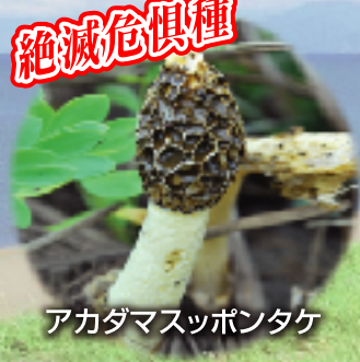
アカダマスッポンタケ