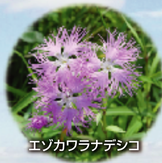
エゾカワラナデシコ